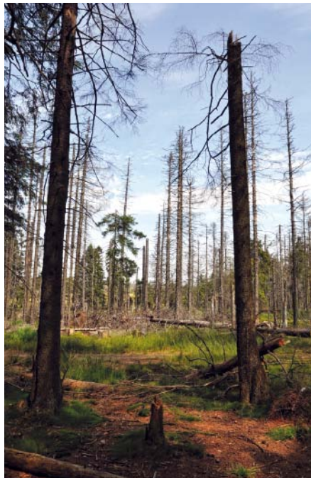
Abb. 1: Waldsterben durch sauren Regen.

Chemische Grundlage des sauren Regens ist die Umsetzung von \text{SO}_2 zu Schwefelsäure bzw. \text{NO}_x zu Salpetersäure in der Atmosphäre und damit die Versauerung des Regenwassers. Die damals in Deutschland verbindlich eingeführte Rauchgasentschwefelung für industrielle Anlagen ab 1974 [7] hat zwar Früchte getragen, da weniger \text{SO}_2 in die Luft gelangte und damit weniger Schwefelsäure entstehen konnte (Abb. 2). Dennoch werden immer noch u. a. historische