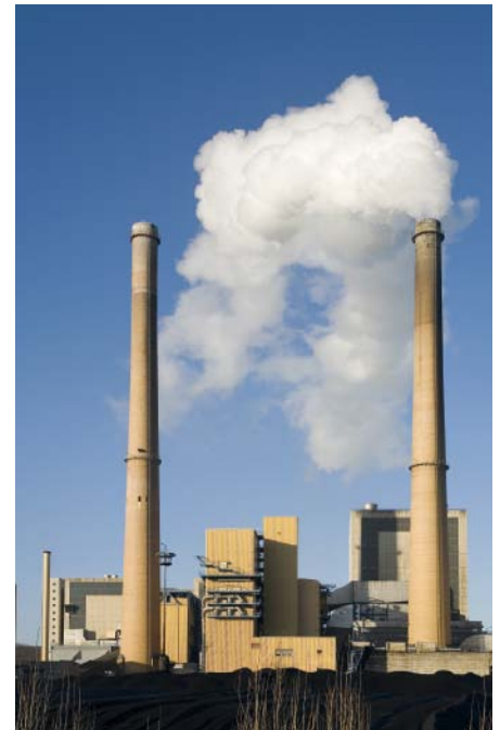
Abb. 2: Industrieanlagen verursachen sauren Regen.

Gebäude durch Regen mit niedrigem pH-Wert in der Bausubstanz angegriffen. Hier könnte man vermuten, dass dieses Phänomen lediglich von nationaler Bedeutung sei und jedes Land seinem eigenen sauren Regen ausgesetzt ist. Dies ist aber nicht der Fall, da die Bildung des sauren